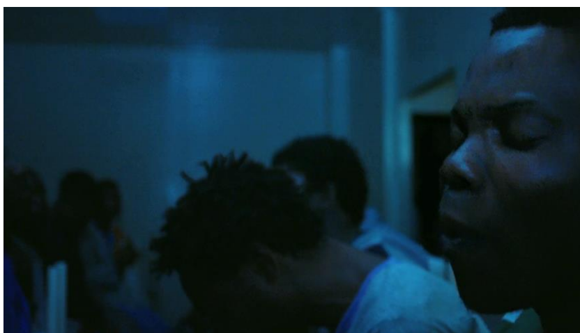
Figuras 2 e 3. Refugiados sendo examinados por oficiais do governo italiano e, posteriormente, agrupados em abrigo.

Mesmo sem exibir seu enunciador, mesmo sem expor ao espectador os aparatos de registro do real, “Fuocoammare” é em si uma narrativa de trauma, um modo de ler os deslocamentos e conflitos